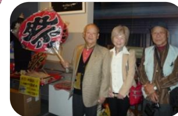
郡上八幡のおいしい お食事とソフトクリームを いただいて、元気いっぱい！ 無事に帰ってきました。