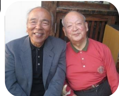
友の会の皆さま 今年もありがとうございました。 来年も元気にご参加ください。