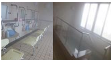
歩いて入れる入浴場