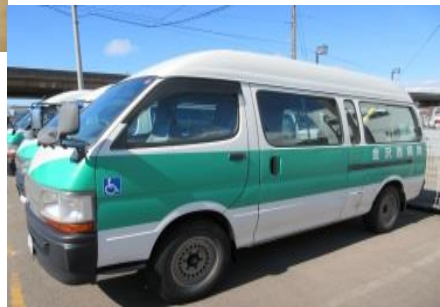
送迎車は緑のラインが目印です。

要支援・要介護認定を受けられた方を対象に、理学療法士・作業療法士等の専門職を中心に、在宅生活を安心して、自分らしく生活できるように心身機能・活動よりアプローチを行い、リハビリ支援を行っています。